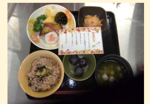
敬老会でのお食事

～ミールラウンド～ お食事の様子を観察し、食事姿勢や噛み方、飲みこみ方、お食事の形態が適切かなど多職種で評価しています。