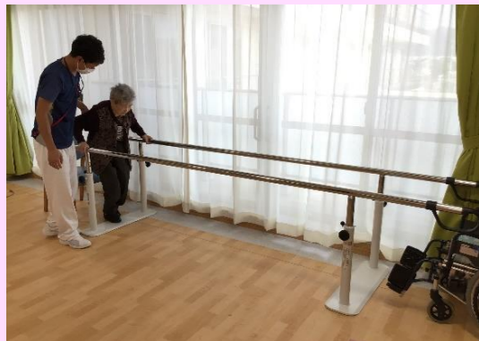
機能訓練スペース

機能訓練 機能訓練スペースで専門職員がリハビリを行い生活機能の維持に努めます。なが～い廊下をお話しながら一緒に歩きます。