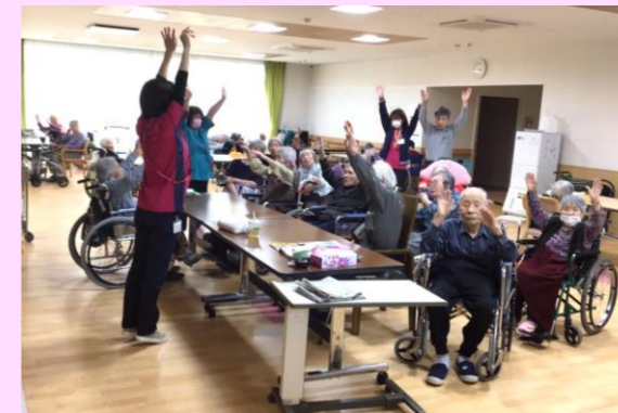
レクリエーションの様子