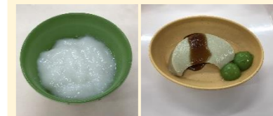
嚥下食(嚥下調整食2-1~2-2)