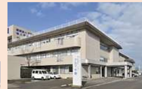
介護老人保健施設 アルマ千寿