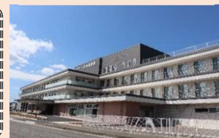
特別養護老人ホーム たんぽぽ苑

体調急変等の受診は、つくし野病院が対応します。通院・入院・リハビリ・訪問診療等にも対応していますので、医療面で最大限の安心感を提供します。また、施設への入所を希望される方は、スムーズに手続きが進むよう、千寿の森のスタッフがお手伝いをします。