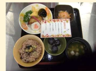
敬老会でのお食事

～ミールラウンド～ お食事の様子を観察し、食事姿勢や噛み方、飲みこみ方、お食事の形態が適切かなど多職種で評価しています。