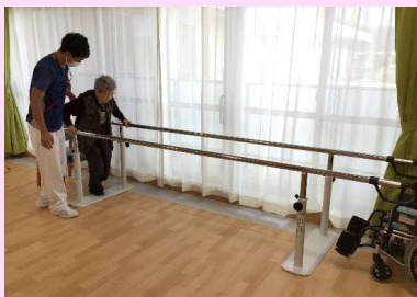
機能訓練スペース

機能訓練 機能訓練スペースで専門職員がリハビリを行い生活機能の維持に努めます。なが～い廊下をお話しながら一緒に歩きます。